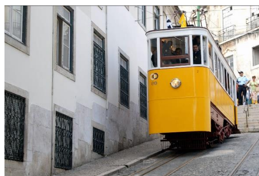
Fig. 2 – Fotografia recente do Ascensor da Glória.

Em 2002 foi classificado como Monumento Nacional e mantém-se em funcionamento até aos dias de hoje, fazendo a ligação entre os Restauradores e São Pedro de Alcântara.