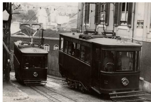
Fig. 1 – Fotografia de 1930 do Ascensor da Glória.

Inicialmente, o seu sistema de tração era de cremalheira e cabo por contrapeso de água. Este sistema foi substituído por uma máquina a vapor, antes da sua eletrificação em 1915.